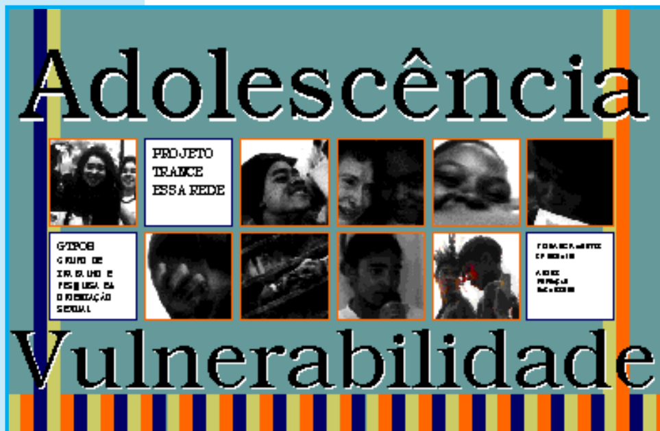
Capa do álbum seriado publicado pelo GTPOS